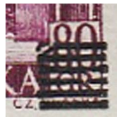
il.8 – forma V

Odnosnie formy, którą umownie określiłem jako szóstą (F.VI – il.9), mam wątpliwości czy różnice wymiarów stwierdzone w czworobloku metrykalnym, w stosunku do znaczków z tych samych pól, przedrukowanych formami II i III, dają dostateczne podstawy do stwierdzenia istnienia kolejnej formy przedrukowej, chociaż podobnej wielkości różnice autorzy artykułu z 2006 r. uznali za potwierdzające istnienie formy III.