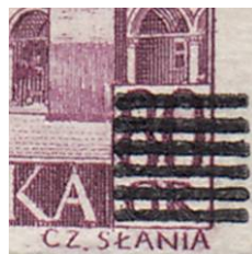
il.6 – forma III