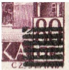
il.4 – forma I