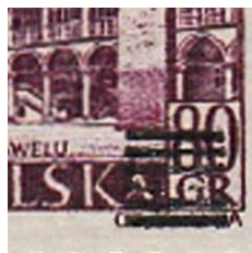
il.5 – forma II