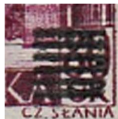
il.7 – forma IV