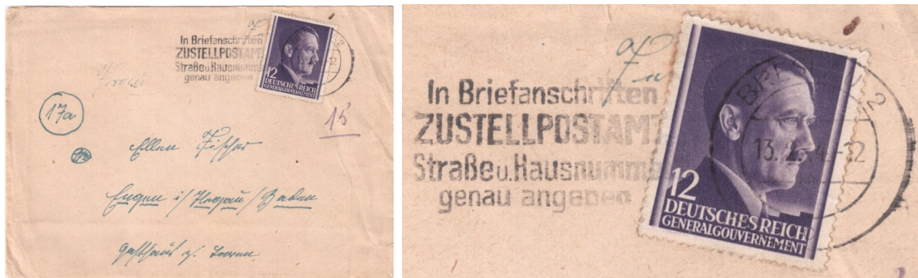
il. 1 - Awers koperty listu ze znaczkiem GG ostemplowanym w Breslau (Wrocław) w Rzeszy i kasownik propagandowy odbity we Wrocławiu z tekstem kas. propag. Fi. nr VIII.

Poniżej na il. 1 pokazano awers koperty listu ze znaczkiem GG Fi. nr 75. List został wysłany 13.2.1944 z Breslau (Wrocław) w Rzeszy do miejscowości Engen im Hegau / Baden w Rzeszy. W powiększeniu pokazano kasownik z tekstem propagandowym znanym z Radomia 1 (Fi. nr VIII), ale z datownikiem „BRESLAU 2” odbitym 13.2.1944.