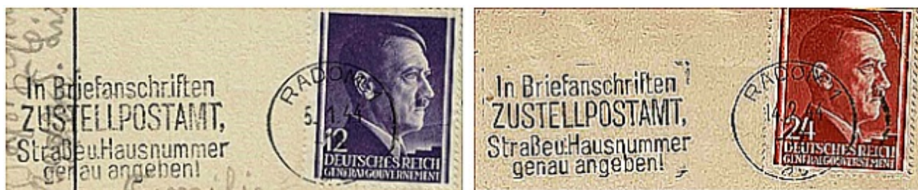
il. 4 – Odbitki wirnika mechanicznego GG nr VIII z Radomia.

W katalogu Fischera Tom II pokazano tylko tekst kasownika propagandowego nr VIII bez datownika. Powyżej załączam 4 przykłady kompletnych kasowników propagandowych z jednoobróczkowymi datownikami Radom 1 z wyróżnikami „ac”, il. 4. Pewnie w przyszłości katalog pokaże ilustrację kasownika w całości.