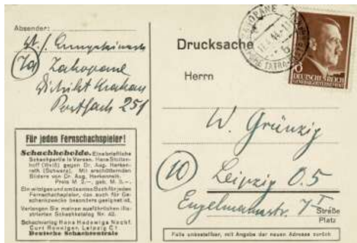
il.2 - awers pocztówki do korespondencyjnej gry w szachy